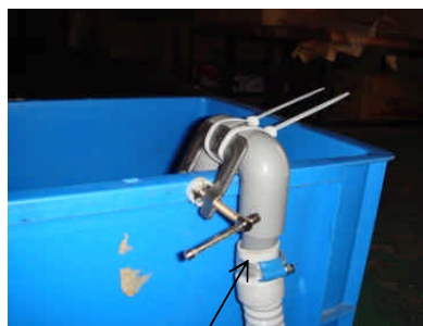
中間タンクに差し込んでいる配管のホースのねじをゆるめてエアをかます